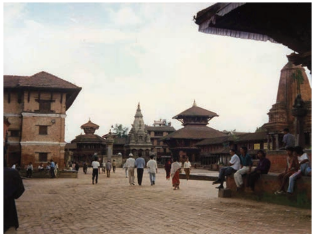
Ἄλλη ἄποψη τῆς Πλατείας Ντούρμπαρ.

Οἱ τεχνίτες ποὺ δημιούργησαν ὅλα αὐτὰ τὰ κομψοτεχνήματα, ἀλλὰ διακρίθηκαν κυρίως στὸ χῶρο τῆς ξυλογλυπτικῆς, προέρχονται ἀποκλειστικὰ ἀπὸ τὴ φυλὴ τῶν Νεβάρ, ποὺ εἶναι οἱ ἀρχαιότεροι κάτοικοι τῆς κοιλάδας τοῦ Κατμαντοῦ, ἀπὸ τὰ προϊστορικὰ ἤδη χρόνια. Οἱ Νεβάρ, ποὺ ἀριθμοῦν σήμερα γύρω στὰ 600.000 ἄτομα, εἶναι οἱ καλλιτέχνες ποὺ γέμισαν μὲ τὰ ἀνεκτίμητα ἔργα τους ὄχι μόνον τὶς περισσότερες περιοχὲς τοῦ Νεπάλ καὶ κυρίως τὴν κοιλάδα τοῦ Κατμαντοῦ ἀλλὰ καὶ τὸ Θιβέτ ὅπου ἐργάστηκαν ἐπὶ δέκα αἰῶνες. Ἀξιοσημείωτο εἶναι πὼς οἱ μόνες περιοχὲς ποὺ δὲν ἔχουν νὰ ἐπιδείξουν ἔργα τέχνης στὸ Νεπάλ εἶναι αὐτὲς ἀκριβῶς ὅπου οἱ Νεβάρ δὲν πάτησαν τὸ πόδι τους. Πάντοτε ἀποτελοῦσαν κι ἐξακολουθοῦν νὰ ἀποτελοῦν μιὰ κλειστὴ κοινότητα, ὅπως οἱ συντεχνίες τοῦ Μεσαίωνα στὴ Δύση, μὲ παράξενα θρησκευτικὰ ἔθιμα καὶ πολλὲς προλήψεις, καθὼς καὶ σειρὰ ἀσφυκτικῶν ἀπαγορεύσεων ποὺ καθορίζουν τὶς μεταξὺ τους σχέσεις καὶ συμπεριφορές.