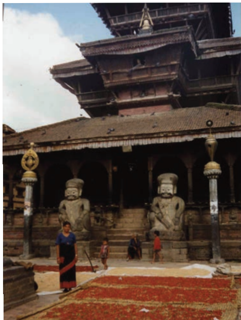
Ἡ πλατεία τοῦ ναοῦ τοῦ Ναττατρέγια μὲ τὶς κόκκινες πιπεριές ποὺ ἄπλωσαν οἱ κάτοικοι γιὰ νὰ ξεραθοῦν στὸν ἥλιο.

Ἔχει πιά βραδιάσει γιὰ τὰ καλὰ ὅταν περνᾶμε ἀπὸ τὴ γειτονιὰ τῶν κεραμέων πρὶν ἀφήσουμε τὸ Μπακταπούρ γιὰ νὰ ἐπιστρέψουμε στὸ Κατμαντού. Ἀπὸ τὴν παρακείμενη πλατεία φτάνει ὁ ἀπόηχος τῆς γιορτῆς ποὺ δείχνει πὼς θὰ κρατήσῃ ὡς ἀργὰ τὴ νύχτα. Ὅμως οἱ κεραμοπλάστες δὲν φαίνεται νὰ ἐπηρεάζονται ἀπ' αὐτό. Σκυμμένοι πάνω ἀπὸ τὸν πηλό τους, ἐξακολουθοῦν αἰῶνες τώρα νὰ δουλεύουν μὲ τὴν ἴδια πάντοτε ἀμετάβλητη τεχνικὴ, παραμένοντας στὴν ἀνωθυμία καὶ φτιάχνοντας λειτουργικὰ κι ἀρκετὰ ἐφήμερα σκεύη καθημερινῆς χρήσης.