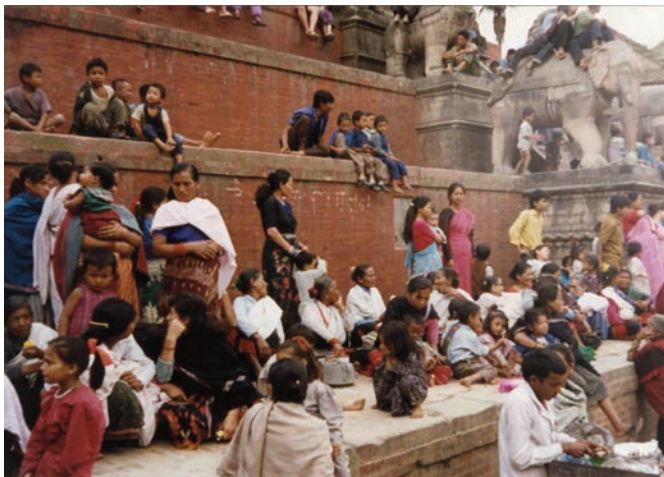
Στὰ πόδια τοῦ ναοῦ τοῦ Νυαταπόλα τὸ πολὺχρωμο ἀνθρωπομάνι παρακολουθεῖ μιὰ ἱερὴ λιτανεία.

τὰ δημόσια πλυντήρια καταλήγει στὴν πλατεία τοῦ ναοῦ τοῦ Ναττατρέγια, πού, κατὰ τὰ θρυλούμενα, κατασκευάστηκε ἀπὸ τὴν ξυλεία ἑνὸς μόνο δέντρου. Ὁ ναὸς αὐτός, ποὺ εἶναι ἀφιερωμένος στὸν Βισνού, ἔχει τρεῖς ἐπάλληλες στέγες καὶ ἐντυπωσιάζει μὲ τὶς γραμμές