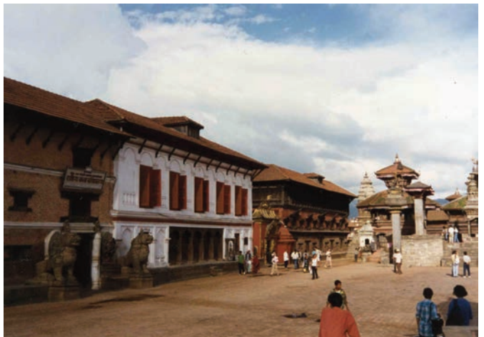
Τὰ βασιλικά ἀνάκτορα τοῦ Μπακταπούρ.

Τὰ βασιλικά ἀνάκτορα ἀποτελοῦνται ἀπὸ δύο ἐπιμήκη κτίρια ποὺ ἐνώνονται μεταξύ τους καὶ καταλαμβάνουν σχεδὸν ὅλη τὴ μία πλευρὰ τῆς πλατείας ἀπὸ τὴ Χρυσὴ Πύλη, ἀριστούργημα τῆς νεπαλέζικης μικροτεχνίας, ἀπὸ ἐπιχρυσωμένο χαλκὸ, τοῦ 17ου αἰώνα, ποὺ ἀπεικονίζει μιὰ θεὰ μὲ τέσσερα κεφάλια. Περνώντας τὴ Χρυσὴ Πύλη μπορεῖ κανεὶς νὰ ἐπισκεφτεῖ τοὺς ναοὺς ποὺ βρίσκονται στὴν αὐλή, ἀπὸ ἔξω ὅμως, γιατί ἡ εἴσοδός τους