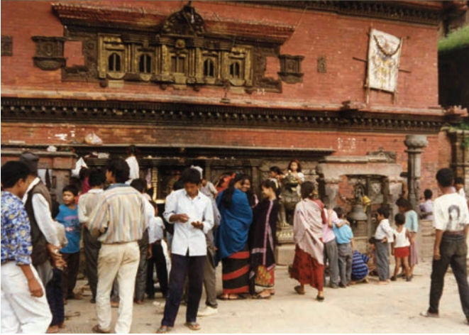
Ὁ κεντρικὸς δρόμος τῆς πόλης μὲ τὰ ὑπέροχα διώροφα σπίτια καὶ τὰ γραφικὰ μικρομάγαζα

Ἐναντι εἰσιτηρίου, γιὰ τοὺς ξένους φυσικά, περνᾷ στὴν Πλατεία Ντούρμπαρ, δηλαδὴ τὴν Πλατεία τῶν Ἀνακτόρων, κι ἀμέσως ἐκτινάσσεσαι ἄφρονος δεκάδες χρόνια πίσω στὸ χρόνο. Οἱ πλατεῖες Ντούρμπαρ στὶς βασιλικὲς πόλεις τῆς κοιλάδας τοῦ Κατμαντοῦ εἶναι