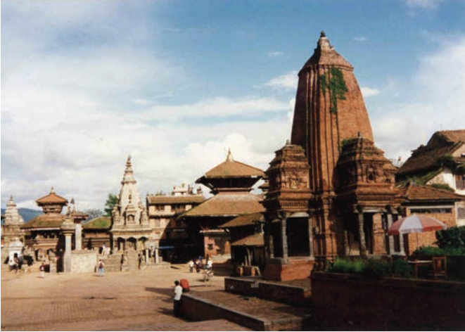
Ἀποψη τῆς Πλατείας Ντούρμπαρ, δηλαδή τῆς Πλατείας τῶν Ἀνακτόρων.

Στὸ Νεπάλ ὑπάρχει ἓνας μόνον ἀρχιτεκτονικὸς ρυθμὸς, ποὺ ἀπλῶς προσαρμόζεται στὶς