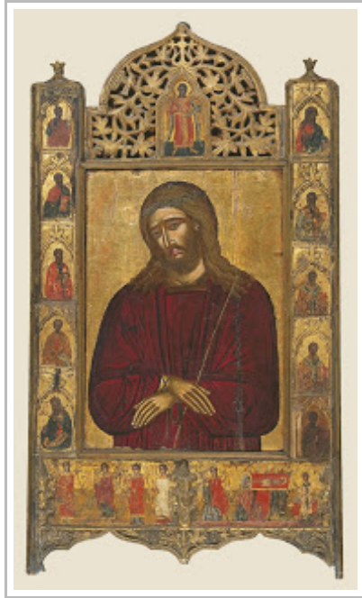
Ἴδε ὁ Ἄνθρωπος (16ος αἰ.), φορητὴ εἰκόνα, 57,8x40 ἐκ., Συλλογὴ Λοβέρδου, Βυζαντινὸ καὶ Χριστιανικὸ Μουσεῖο Ἀθηνῶν.

Τὴν ἱερότητα τοῦ Ἀνθρώπου καὶ παρεπομένως τοῦ ὕλικου του φορέα δὲν τὴν εἰκονίζει τίποτα ἐναργέστερα ἀπὸ τὸν χριστικὸ σταυρὸ, τὸν ὁποῖο ἐξαγίασε στὴν αἰωνιότητα ὁ Ἰησοῦς μὲ τὴ σταύρωσή Του. Ὁ ἐν λόγῳ σταυρὸς ἀποτελεῖ ὑπέρβαση τοῦ ἑλληνικοῦ σταυροῦ μὲ τὶς τέσσερις ἰσομήκεις κεραίες, πού ἐγγράφεται σὲ τετράγωνο, καθὼς σ' αὐτὸν τὸν τελευταῖο ὁ ὀριζόντιος ἄξονας, διασπώντας τὴ στατική ἰσορροπία, μετακινεῖται στὸν κάθετο ἄξονα πρὸς τὰ πάνω. Ὁ χριστικὸς σταυρὸς εἶναι μιὰ γραφικὴ, ἀφαιρετικὴ ἀπεικόνιση τοῦ ἀνθρώπου μὲ ἀπλωμένους τοὺς βραχίονες καὶ εὐθυγραμμισμένο τὸ ὑπόλοιπο σῶμα του. Τοῦτο γίνεται ἐμφανέστερο στὸν αἰγυπτιακὸ σταυρὸ τῆς Ἰσιδος, τὸ Ἄνκχ, ὅπου ἡ κλειστὴ καμπύλη πάνω στὸν ὀριζόντιο ἄξονά του, στὴ θέση τοῦ ἄνω τμήματος τῆς συνήθους κάθετης κεραίας, μπορεῖ κάλλιστα νὰ ἐκληφθεῖ ὡς ἡ ἀνθρώπινη κεφαλή. Πιὸ ἐκπληκτικὴ ὅμως ἐπιβεβαίωση αὐτῆς τῆς θέσης μᾶς τὴν παρέχει τὸ πασίγνωστο κυπριακὸ σταυρόσχημο εἰδώλιο ἀπὸ στεατίτη τῆς χαλκολιθικῆς περιόδου (3000-2300 π.Χ.), μὲ πιθανολογούμενη προέλευση ἀπὸ τὴν Πάφο, τὸ ὁποῖο φυλάσσεται στὸ Κυπριακὸ Μουσεῖο, στὴ Λευκωσία. Τὸ ἐν λόγῳ εἰδώλιο, ὕψους 15,3 ἐκ., μὲ ἀνάγλυφα χαρακτηριστικὰ τοῦ προσώπου καὶ μακρὸ λαιμό, φέρει περιδέραιο μὲ ἀνάρτημα σὲ σχῆμα ἀνθρώπινου πανομοιότυπου εἰδωλίου. Ἀπ' ὅλα αὐτὰ προκύπτει πῶς ὁ ἄνθρωπος εἶναι τὸ ἐντελῶς ξεχωριστὸ μέσα στὴ Δημιουργία ὄν, τὸ ὁποῖο μπορεῖ νὰ ὑπερβεῖ τὴν κατάστασή του.