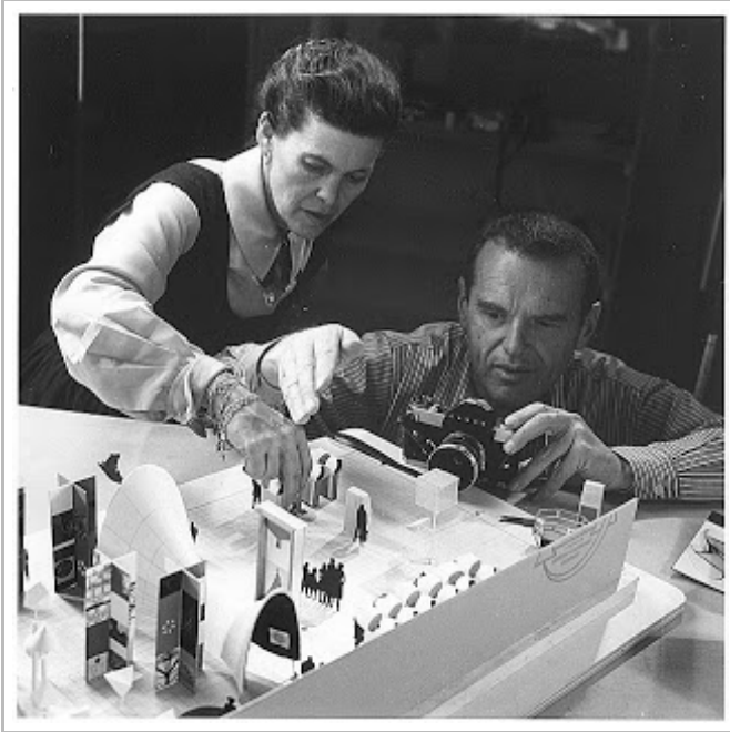
Ὁ Τσαρλς καὶ ἡ Ρέι Ἴμς κατὰ τὴν προετοιμασία μιᾶς ἐκθεσῆς τους τὸ 1960.

Τσαρλς (Charles) καὶ ἡ Ρέι (Ray) Ἴμς (Eames), εἶχαν τὴν ἰδέα νὰ μετρήσουν καὶ νὰ ἀπεικονίσουν τὰ διάφορα μεγέθη στὴ Φύση, ἀπὸ τοὺς ἀπώτερους γαλαξίες τοῦ σύμπαντος ὡς τὸν ἄνθρωπο, κι ἀπὸ τὸν ἄνθρωπο ὡς τὰ ἄτομα τῶν χημικῶν στοιχείων, χρησιμοποιώντας τὶς ἴδιες μονάδες μέτρησης, δηλαδή μία κλίμακα τῶν δυνάμεων τοῦ 10 σὲ μέτρα. Πράγματι, μὲ προσεκτικότερη παρατήρηση τῆς Φύσης, βλέπουμε τὰ μεγέθη νὰ ἐκδιπλώνονται σὲ κλίμακες δυνάμεων τοῦ ἀριθμοῦ 10, μὲ ἀφετηρία εἴτε πρὸς τὰ ἄνω εἴτε πρὸς τὰ κάτω τὸ ἀνθρώπινο σῶμα, ὅπου κάθε κλίμακα μεγέθους εἶναι κι ἓνας βασικὸς σταθμὸς ἀπὸ ἐκείνους ποὺ προαναφέραμε. Βλέπουμε δηλαδή νὰ δημιουργεῖται, μὲ κέντρο τὴ βαθμίδα τοῦ ἀνθρώπου, μία Φυσικὴ Κλίμακα Μεγεθῶν πρὸς τὰ ἄνω (μακρόκοσμος) καὶ μία πρὸς τὰ κάτω (μικρόκοσμος).