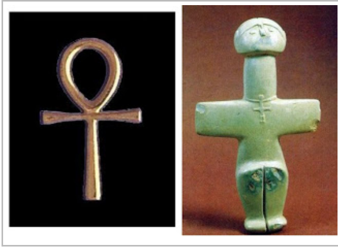
Αριστερά: Ὁ σταυρός τῆς Ἰσιδος, γνωστότερος ὡς Ἄνκχ. Δεξιά: Σταυρό-σχημο εἰδώλιο, πιθανὴς προέλευσης ἀπὸ τὴν Πάφο, ὕψους 15,3 ἐκ. (3000-2300 π.Χ.), Κυπριακὸ Μουσεῖο, Λευκωσία.

Τὸ ἀνθρώπινο ὄν εἶναι ἓνα μὴ ὀλοκληρωμένο δημιούργημα ἐν ἀντιθέσει πρὸς τὰ θεῖα ὄντα πὺν εἶναι ὀλοκληρωμένα δημιουργήματα. Τὸ ἀνθρώπινο ὄν εἶναι ἓνα κατὰ συνθήκην ὄν, ἀποτέλεσμα τῆς ἐκφρασης τῆς Ἰδέας «Ἀνθρώπος». Συνεπῶς δὲν εἶναι αὐτὸς οὗτος ὁ Ἀνθρώπος. Σὲ αὐτὸν ὡστόσο ἐγκείται, ἀπὸ ἀνθρώπινο ὄν πὺν εἶναι κατὰ τὴν ὕλομορφοποίησή του, νὰ συντελέσει στὴν ἐμφάνιση τοῦ ὄντος «Ἀνθρώπος». Τότε θὰ ἔχει ὀλοκληρωθεῖ ἡ κυκλικὴ πορεία: Ἰδέα «Ἀνθρώπος» – ἀνθρώπινο ὄν – ὄν «Ἀνθρώπος».