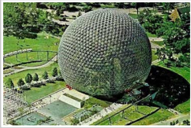
Ὁ Γεωδαιτικός Θόλος

Ὅπως προαναφέρθηκε, ὅλες ἀνεξαιρέτως οἱ ὑλικές μορφές - τόσο οἱ φυσικές ὅσο καὶ οἱ ἀνθρωποποίητες, ἀκόμα δὲ καὶ οἱ λεγόμενες «φανταστικές»-, ἀποτελοῦν ὑλομορφοποιήσεις αἰθερικῶν προτυπώσεων τῶν θείων Ἰδεῶν. Τοῦτο ἐξηγεῖ τὴν ἐμφάνιση ταυτόσημων ἢ παραπλήσιων μυθολογικῶν ἢ συμβολικῶν μορφῶν σὲ διαφορετικούς πολιτισμούς, πού δὲν εἶχαν κατ'ἀνάγκη ἐρθεῖ σὲ ἐπαφή μεταξύ τους. Ἐνδεικτικὰ ἄς ἀναφερθοῦν οἱ μορφές τοῦ ἀγγέλου καὶ τοῦ δράκοντα ἢ τὰ παγκόσμια σύμβολα τοῦ κύκλου καὶ τοῦ σταυροῦ.