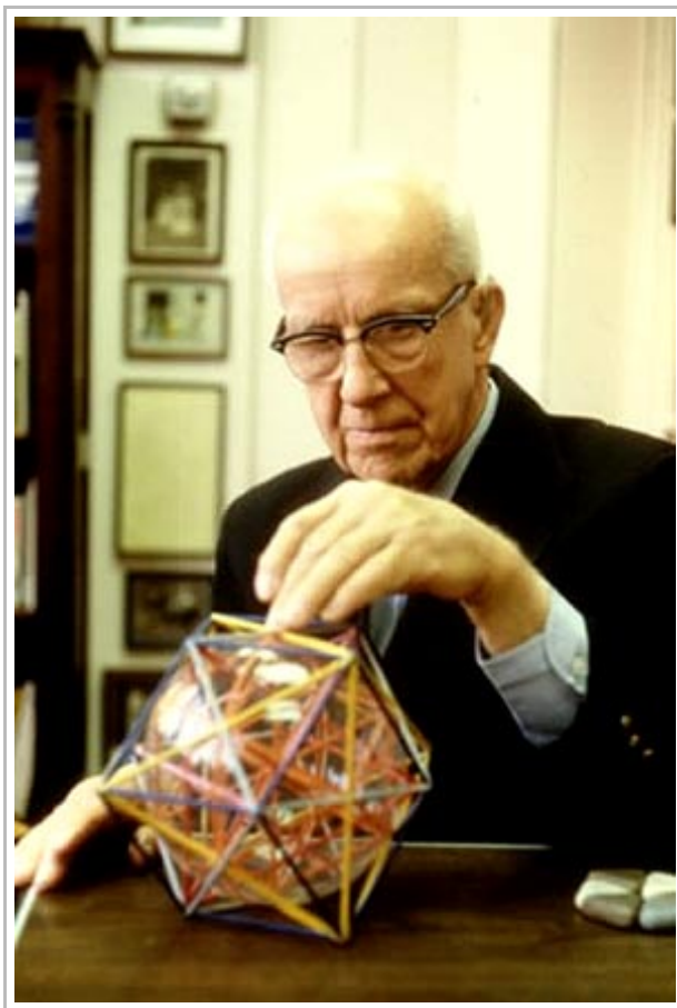
Ο Ρίτσαρντ Μπάκμινστερ Φούλλερ

έν λόγω πρωτοποριακού οικοδομήματος. Αργότερα ωστόσο, το 1985 και πάντως μετά το θάνατο του αρχιτέκτονα, ανακαλύφθηκε πειραματικά στα ένδοαστρικά νεφελώματα, αφού προηγουμένως είχε εντοπιστεί θεωρητικά, μία τρίτη, άγνωστη μέχρι τότε και ισχυρότερη αλλοτροπική μορφή του άνθρακα, εκτός από τον αδάμαντα και τον γραφίτη: ο άνθρακας-60 (C60). Πρόκειται για ένα σφαιρικό μόριο αποτελούμενο από 60 άτομα άνθρακα, που, λόγω της ομοιότητάς του, μορφικά, με τον παραπάνω γεωδαιτικό θόλο, ονομάστηκε προς τιμήν του αρχιτέκτονα του μπακμινστερφουλλερένιο, και απλούστερα φουλλερένιο ή φουλλερίτης. Τούτο αποδεικνύει γι' άλλη μία φορά περίτρανα ότι καμιά ανθρώπινη σύλληψη, ακόμα κι όταν μοιάζει καινοφανής, δεν είναι ουσιαστικά πρωτότυπη. Μια άλλη απόδειξη τούτου είναι οι όνειρικές μορφές που δεν τις έχουμε ξαναδεί ποτέ. Είναι άραγε οι άυλες αυτές μορφές απλώς προϊόντα της φαντασίας μας; Κι αν ευσταθεί αυτή ή υπόθεση, από που τις άντλει ή φαντασία μας; Μά από που άλλου παρά από το Αιθερικό (ή αλλιώς Παγκόσμια Ψυχή) όπου υπάρχουν οι αιθερικές προτυπώσεις τους. Με αυτές συνδεόμαστε όταν βρεθούμε στην κατάσταση του ύπνου, κατά την οποία επιτελείται ή μετάβαση της ατομικής μας ψυχής από το υλικό στο αιθερικό επίπεδο. Άρα, τίποτα το ανθρωποποίητο δεν μπορεί να διεκδικεί δάφνες πρωτοτυπίας, αφού «οὐδὲν καινὸν ὑπὸ τὸν ἥλιον»· απλώς έρχεται κάποτε ή ώρα, ή στιγμή, που αποσύρεται κάποια πτυχή του πέπλου, το οποίο καλύπτει την απειροαίωνια Αλήθεια, κι έτσι αποκαλύπτεται κάπως ή Φύσις-Ίσις.